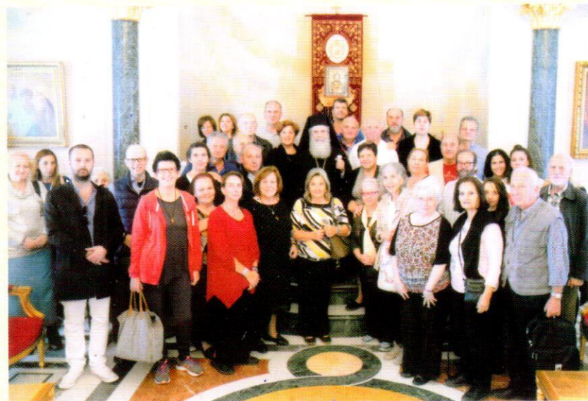
Από την συνάντηση των Προσκνητητών στην Αίθουσα του Θρόνου με την Α. Θ. Μ. Πατριάρχη Ιεροσολύμων Θεόφιλο Γ'.