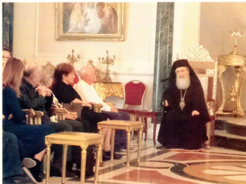
Από την επίσκεψη στον Πατριαρχικό Θρόνο με την Α. Θ. Μ. Πατριάρχη Ιεροσολύμων Θεόφιλο Γ'.

Στις 29/10 - 4/11/2018 πραγματοποιήθηκε με μεγάλη επιτυχία η προσκυνηματική εκδρομή στους Αγίους Τόπους. Επισκεφθήκαμε σχεδόν όλα τα προσκυνήματα εντός και εκτός των τειχών. Εκκλησιαστήκαμε στον Ι. Ναό της Γεννήσεως Βηθλεέμ και στον Ι. Ν. Ιωάννη Προδρόμου Ιορδάνη όπου έγινε ειδική λειτουργία για τα μέλη του Συνδέσμου. Συμμετείχαμε στην αγρυπνία που έγινε στον Πανάγιο Τάφο χοροστατώντας στον Σεβασμιωτάτο Μητροπολίτη Καρητιωιάδος Ησυχίου και άλλων Ιεραρχών. (Και στους 3 εκκλησιασμούς σχεδόν όλα τα μέλη της εκδρομής έλαβαν Θεία Κοινωνία.)