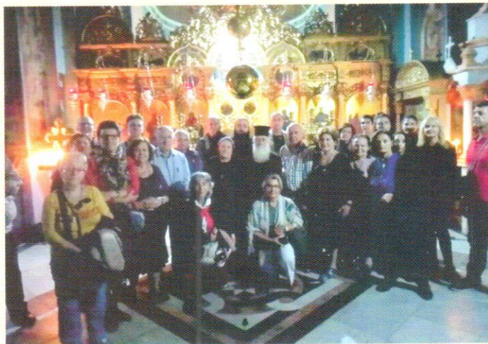
Στην Ι. Μ. Μάρθας & Μαρίας, Βηθανία με τον Αρχ/πο Θαβαρίου Μεθόδιο.