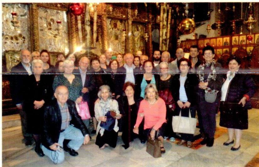
Από την επίσκεψη των μελών του Συν/μου στην Ι. Μ. Αγίου Συμεών (Καταμάνας).