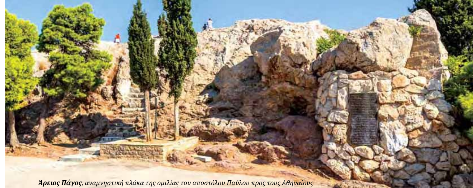
Άρειος Πάγος, αναμνηστική πλάκα της ομιλίας του αποστόλου Παύλου προς τους Αθηναίους