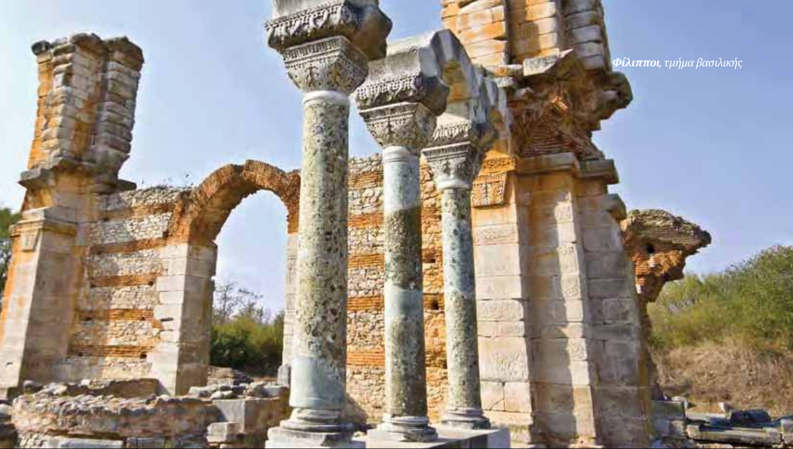
Φίλιπποι, τμήμα βασιλικής