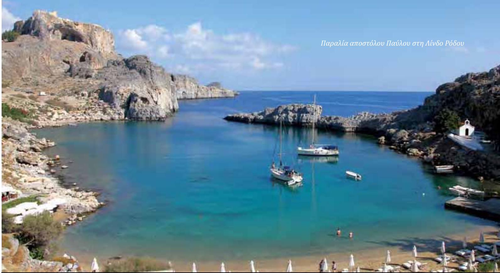
Παραλία αποστόλου Παύλου στη Λίνδο Ρόδου

Τέλος, ένα ιδιαίτερα σημαντικό εύρημα στον αρχαιολογικό χώρο της Κορίνθου είναι μια λατινική επιγραφή που εντοπίστηκε στη μικρή πλατεία ανατολικά του θεάτρου και χρονολογείται στο α΄ μισό του 1ου αιώνα μ.Χ. Η επιγραφή αυτή τοποθετήθηκε εκεί προς τιμήν κάποιου Έραστου, οικονόμου της πόλης της Κορίνθου, ο οποίος χρηματοδότησε την πλακόστρωση της πλατείας ως ανταπόδοση για την τοποθέτησή του στη θέση αυτή. Η σημασία του ευρήματος αυτού έγκειται στο γεγονός ότι πρόκειται προφανώς για τον ίδιο Έραστο που μνημονεύεται στην προς Ρωμαίους επιστολή (16,23) ως οικονόμος της πόλης της Κορίνθου, πιθανώς δε και για τον Έραστο που αναφέρεται και αλλού στην Καινή Διαθήκη (Πράξ. 19,22 και Β΄ Τιμ. 4,20) δεδομένης της σπανιότητας του ονόματος και της συσχέτισής του και πάλι με τον Παύλο και την πόλη της Κορίνθου. Αντίστοιχης σημασίας εύρημα, αν και όχι από τον αρχαιολογικό χώρο της Κορίνθου, αλλά των Δελφών, είναι και η λεγόμενη επιγραφή του Γαλλίωνος , η οποία αποτελεί την αρχαιολογική τεκμηρίωση της αναφοράς του Παύλου στον ομώνυμο ρωμαίο ανθύπατο, κατά την πρώτη επίσκεψή του στην Κόρινθο.