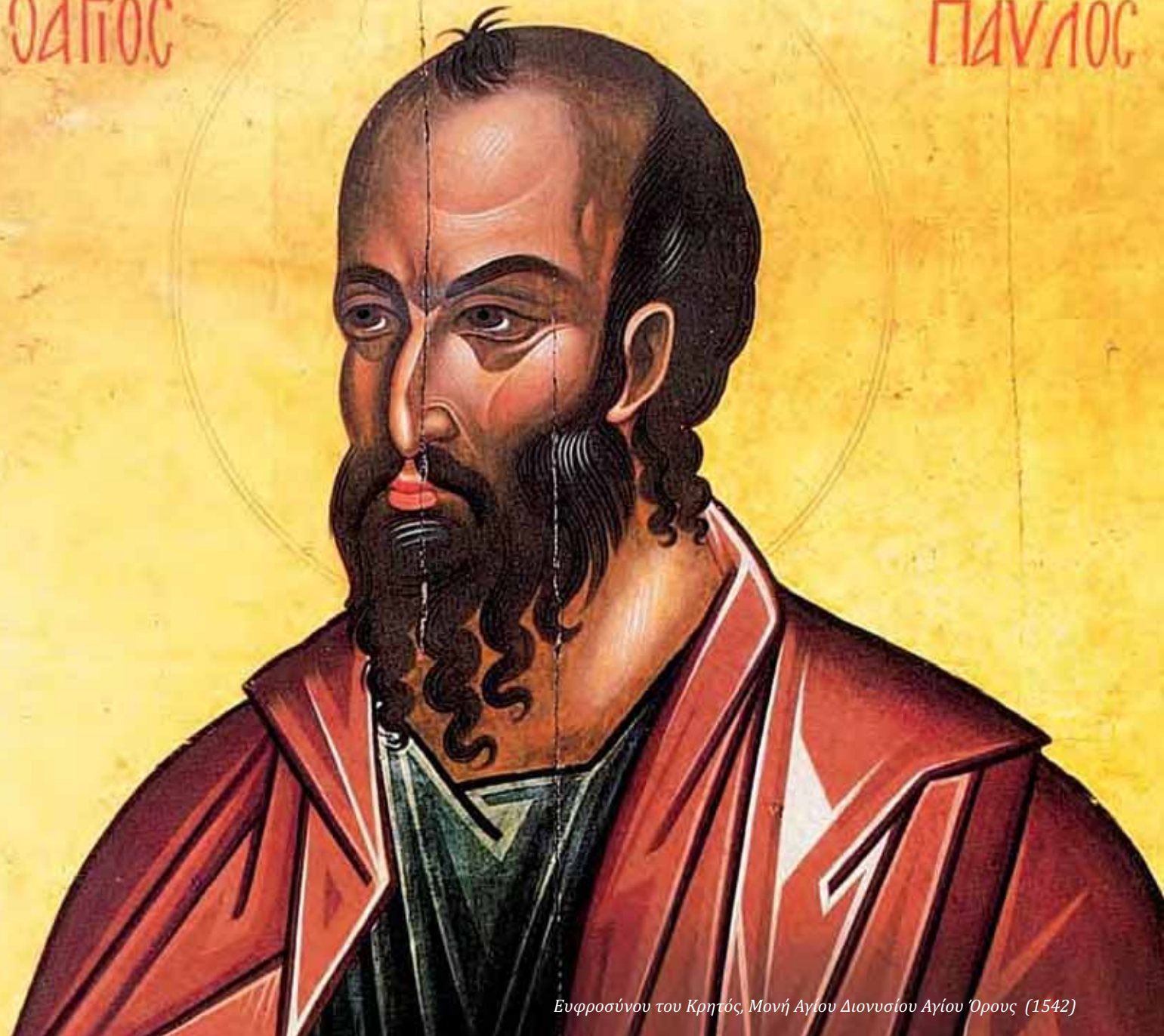
Ευφροσύνου του Κρητός, Μονή Αγίου Διονυσίου Αγίου Όρους (1542)